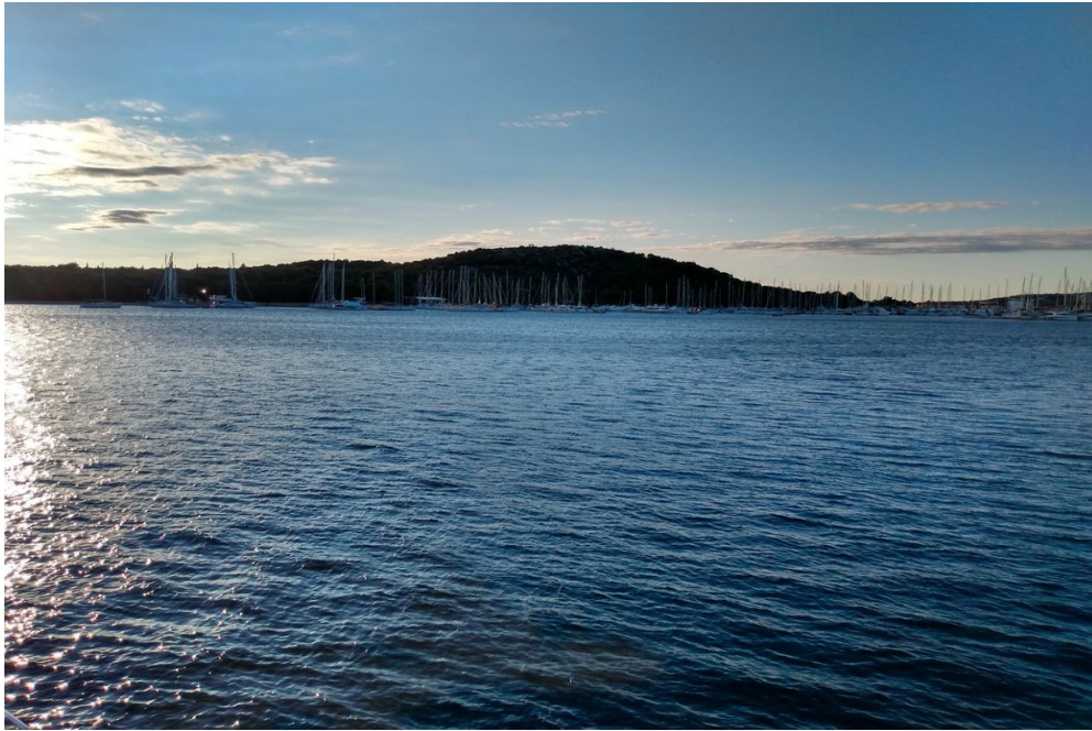
vis a vis zu unserem Liegeplatz die Edel Marina Frapa....