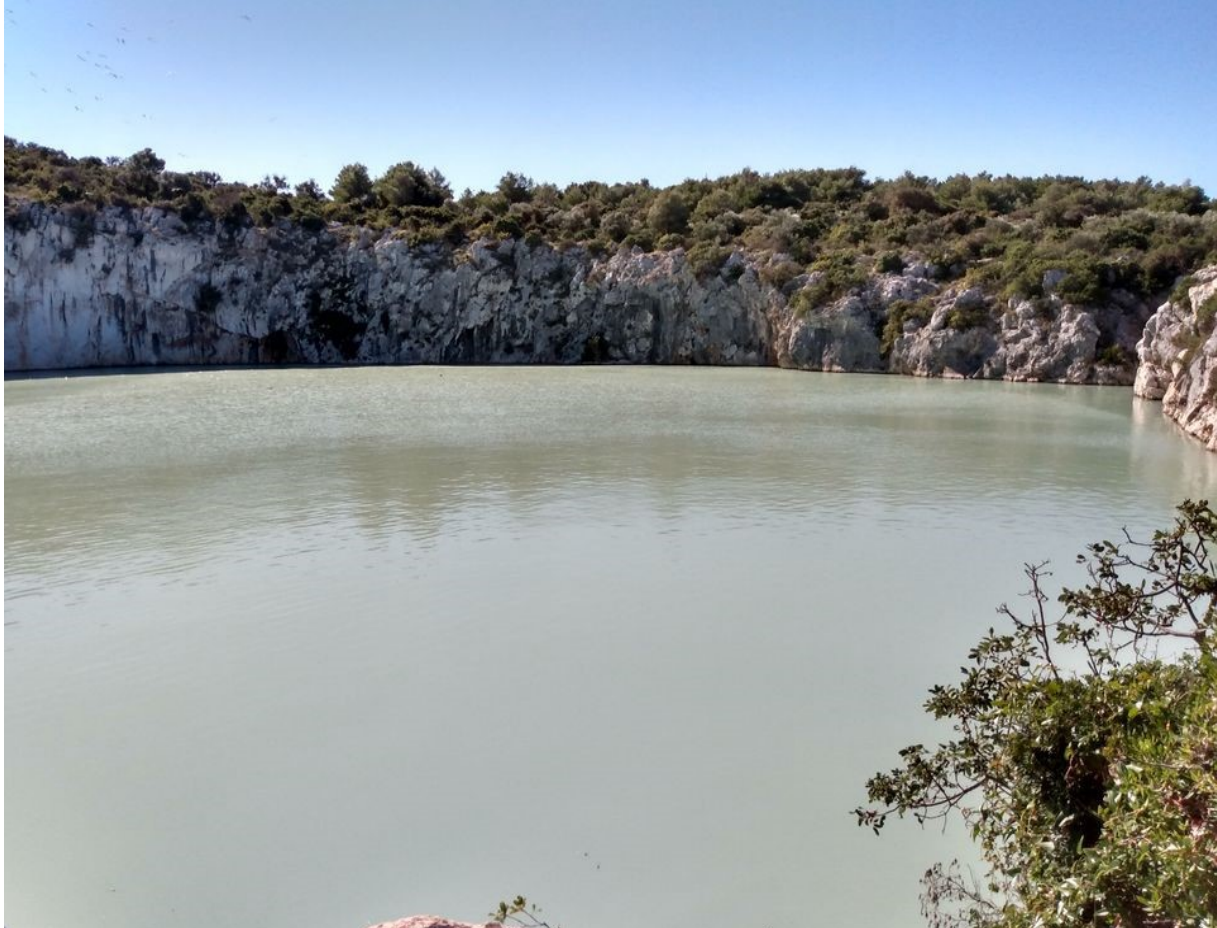
Drachenaugensee, gelb und stinkig

Direkt neben der Marina befindet sich ein weiteres, diesmal geologisches Highlight, der Drachenaugen See . Wie der Name schon nahelegt, natürlich sagenumwoben mit blutrünstigen Geschichten.