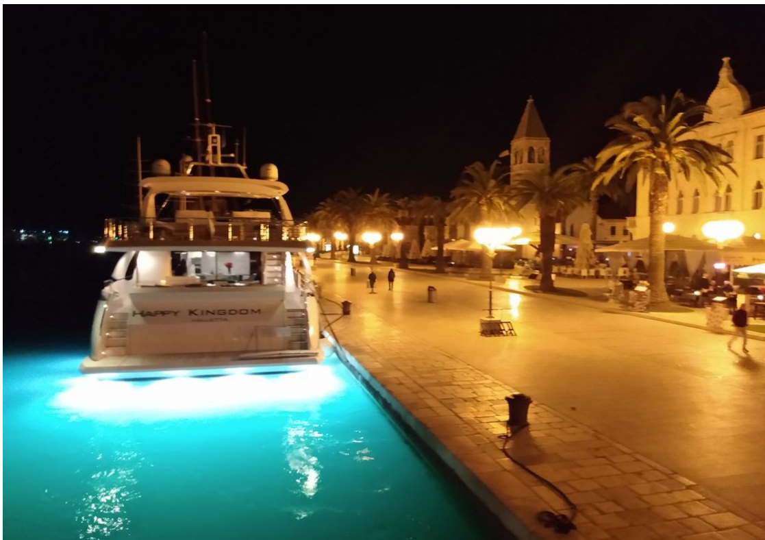
Trogir bei Nacht, die „Happy Kingdom“ sorgt auch des Nachts für azurblaues Wasser.