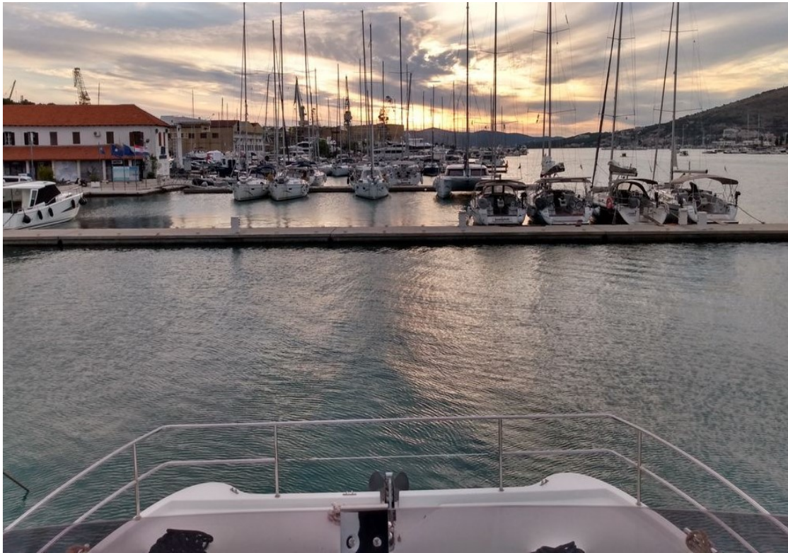
Impressionen von der Fly Teil 2