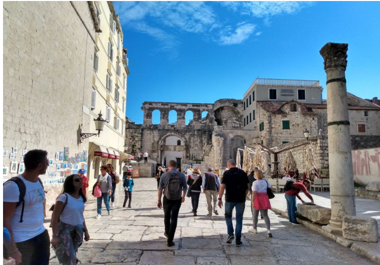
Weiter durch die Altstadt auf den farnefrohen Markt,