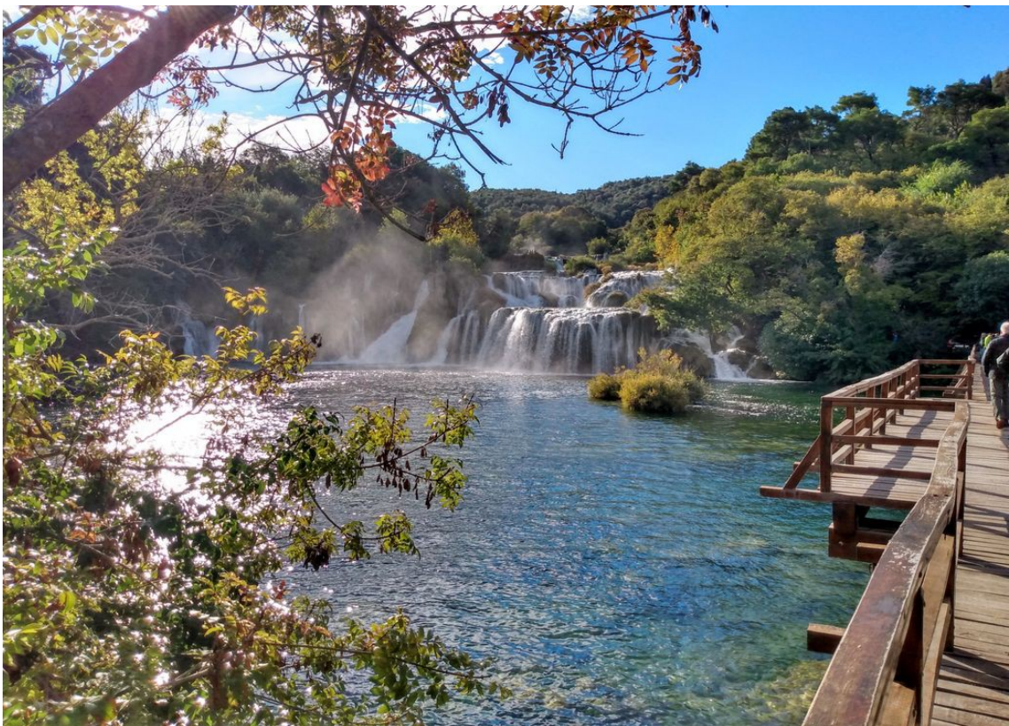
Die Krka sucht sich ihren Weg.