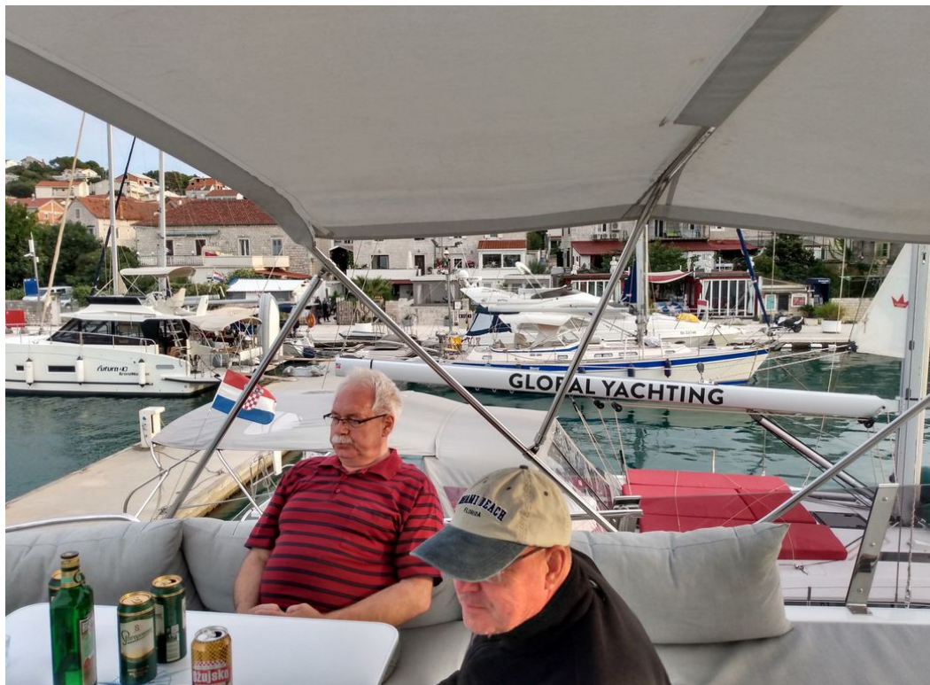
Impressionen auf der Fly Teil 3