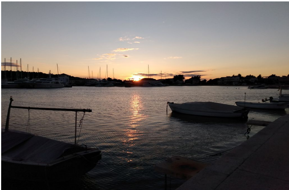
Sonnenuntergang über der Marina Frapa

An den Silhouetten der dort liegenden Schiffe erkennt man schon von gegenüber, dass hier eine andere Liga zu Hause ist. Das wollen wir uns am nächsten Tag genauer anschauen.