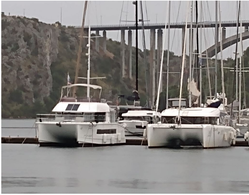
Kalea (links) in der ACI Marina Skradin über die Brücke führt die E 65 nach Süden