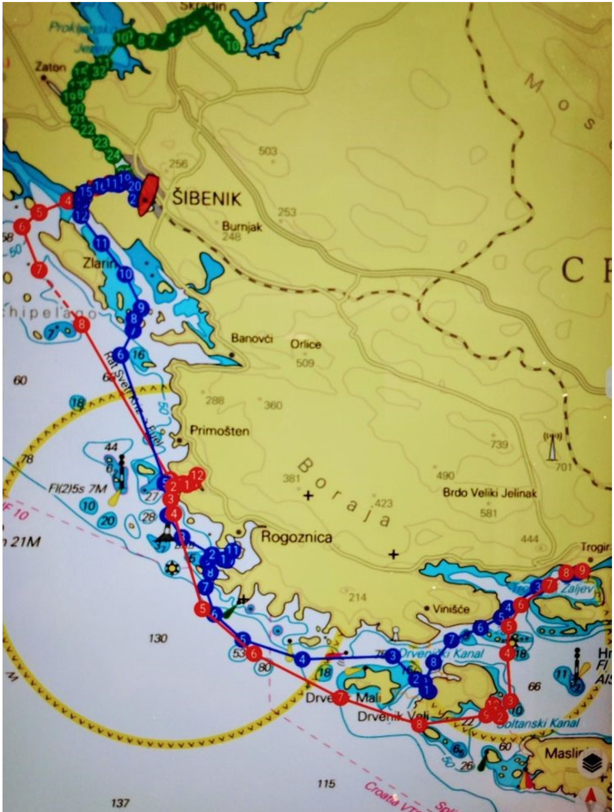
Hier der gesamte Törn : Rote Kurse = Hinreise, Blaue Kurse = Rückreise Grüner Kurs = Reise auf der Krka die letzte Etappe Rogoznica – Šibenik ergab noch einmal 18 NM