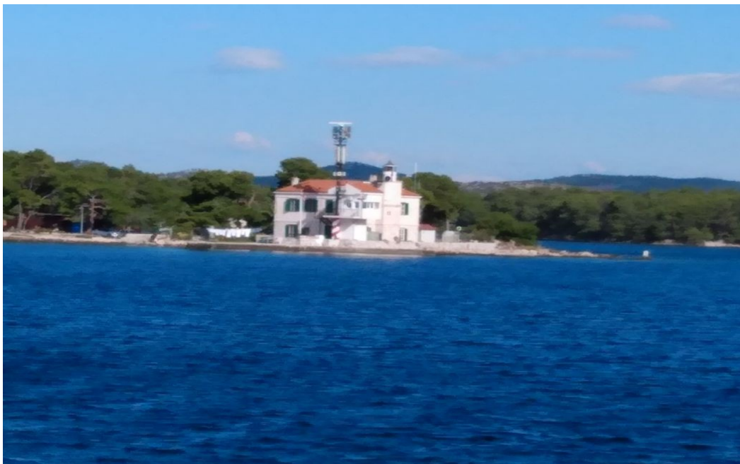
Genau gegenüber das Leuchtfeuer Luka Šibenik, mit Radar, Revier- und Mobilfunk, das in der heutigen Zeit die gleichen Aufgaben erfüllt, wie einst die Festung