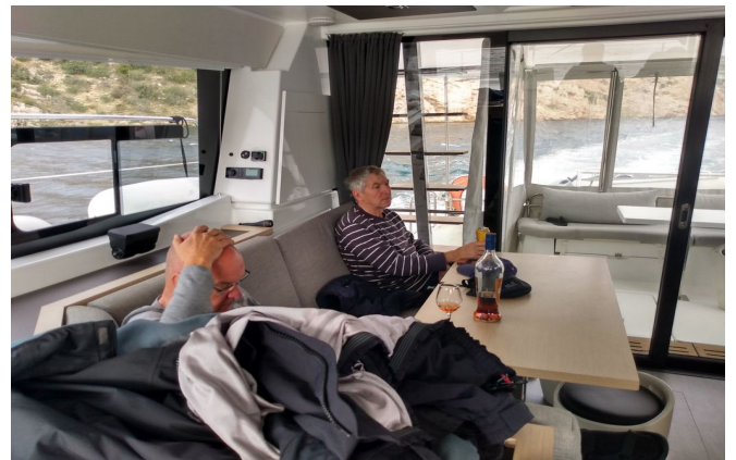
LI am Ruder.. bei Kälte hat ein Innen-Fahrstand durchaus Vorteile