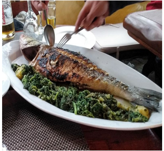
in Skradin gab es den ersten dicken Fisch dieser Reise