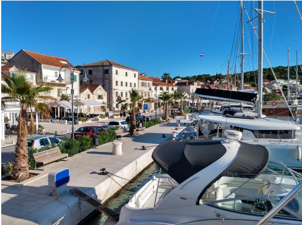
Rogoznica, schöne neue Hafenspromeade, die Bora hat den Himmel klar gefegt

bei der ablandigen Bora kein dramatischer Seegang ausbilden kann. Es gibt nur eine kurze, hackige Welle, die der Doppelrumpfer ohne Probleme glatt bügelte. Allerdings zerpte der Wind heftig am Bimini Sonnensegel, doch zum Glück hielten alle Abspannungen. Somit gab es für uns nur noch die Herausforderung, unter diesen Bedingungen ein sicheres Anlegemanöver in unserem Zielhafen zu absolvieren. Das gelang der Crew dann schließlich, auch mit Hilfe eines aufgeweckten Hafenmeisters im Stadthafen von Rogoznica.