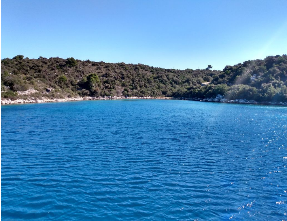
Uvala Mala Luka (Drevenik Veli) ganz alleine....

Tag 5: Trogir - Uvala Mala Luka (Drvenik Veli) – Rogoznica (Stadthafen) Nach einer ruhigen Nacht in Trogir brachen wir am Mittwoch Morgen aus der ACI Marina auf, um in der „Mala Luca“, einer herrlichen Ankerbucht, den Tag zu verbringen. Die Bucht gehört, wie die am Vortag besuchte „Blaue Lagune“, zu Insel Drvenik Veli, nur ist es hier viel ruhiger und wir waren ganz alleine und ja, diese „Lagune“ ist nun wirklich blau