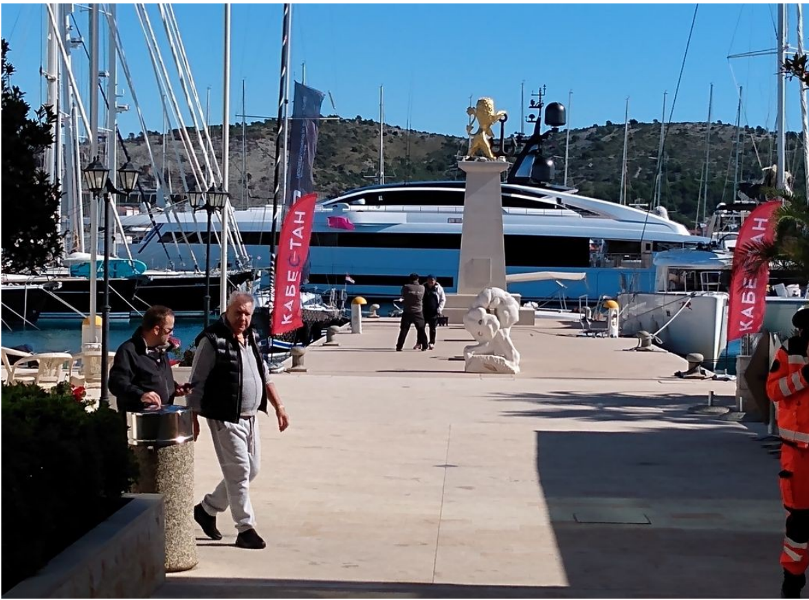
Haupteingang in die Marina, mit goldenem Löwen und „Flagship“

Tag 6: Abwettern in Rogoznica. Eine kleine Wanderung führte uns an diesem Tage zur Marina Frapa. Hier bestätigte sich der am Vorabend gewonnene Eindruck.