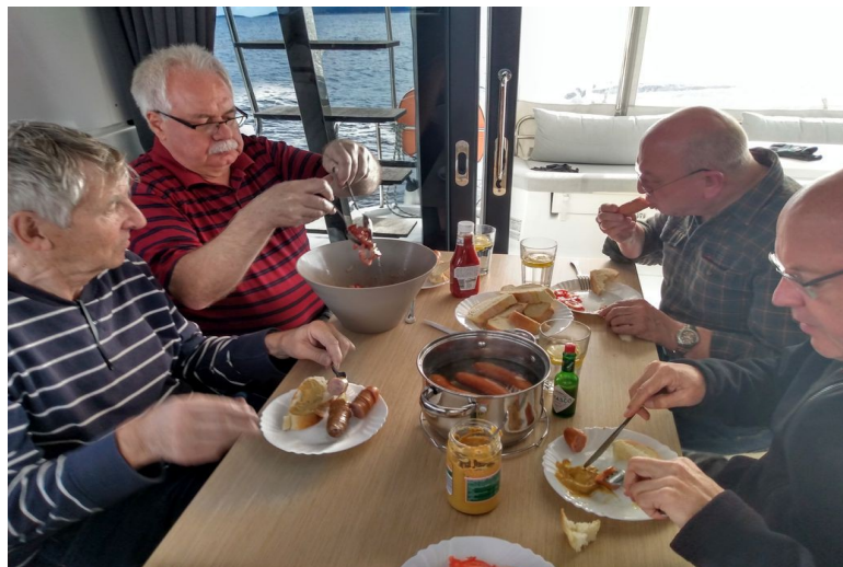
Der „Fang“ wurde von der Küchencrew direkt vor Ort zu einer leckeren Speise verarbeitet...