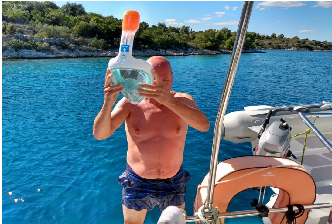
Schon im Indischen Ozean bewährte Tauch-Ausrüstung

Die Adria, - „Karibik der Alten Welt“. Und wenn man das Blau des Wassers genau so malen würde, wie es ist, bestünde die Gefahr, dass das Bild von der Kritik als Kitsch abgetan würde.