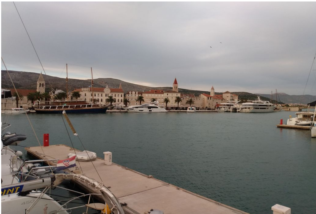
Altstadt Trogir, Impressionen von der Flybridge Teil 1

Aus der Blauen Lagune fahren wir weiter nach Trogir, eine wunderschöne, alte, Dalmatinische Stadt, wo wir in der ACI Marine sicher unterkamen.