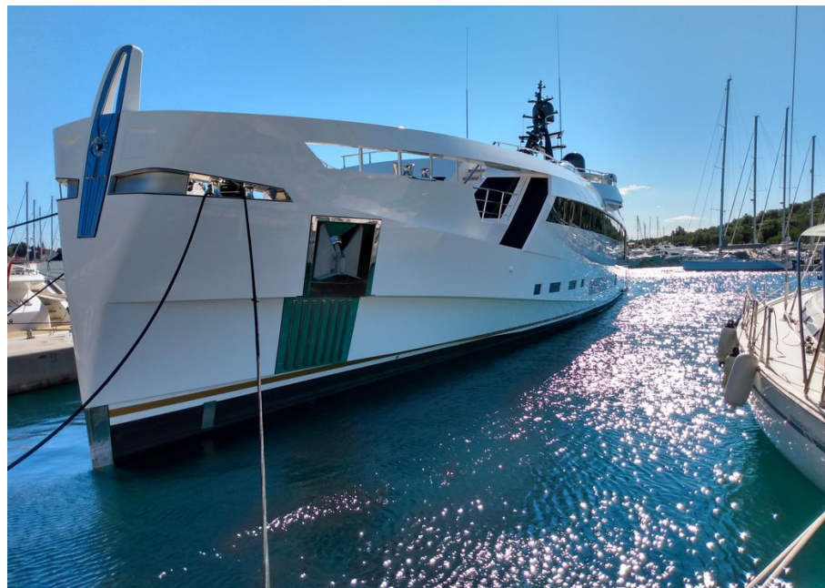
„Panzerkreuzer Potemkin“ Der Eigner dieser Yacht hat zumindest in dieser Marina den Längsten (Frachter)

Hier ist nichts mehr im klassischen Sinne „maritim“, sondern alles eher protzig bis kitschig, was sicherlich dem Geschmack der zahlungskräftigen Klientel, vorwiegend aus der Russischen Föderation, geschuldet ist.