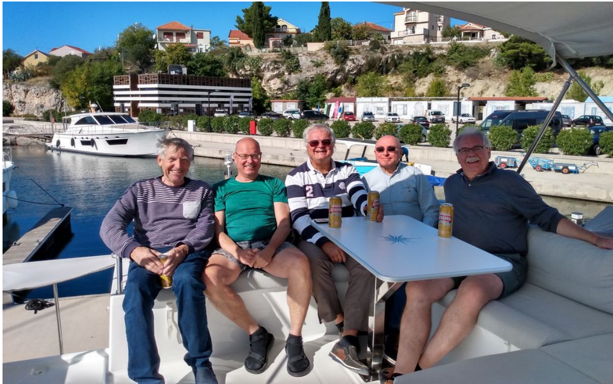
Diethard Jens Rainer Eckard Jürgen

Geschafft. Crew der Kalea beim finalen Anlegerbier auf der Fly