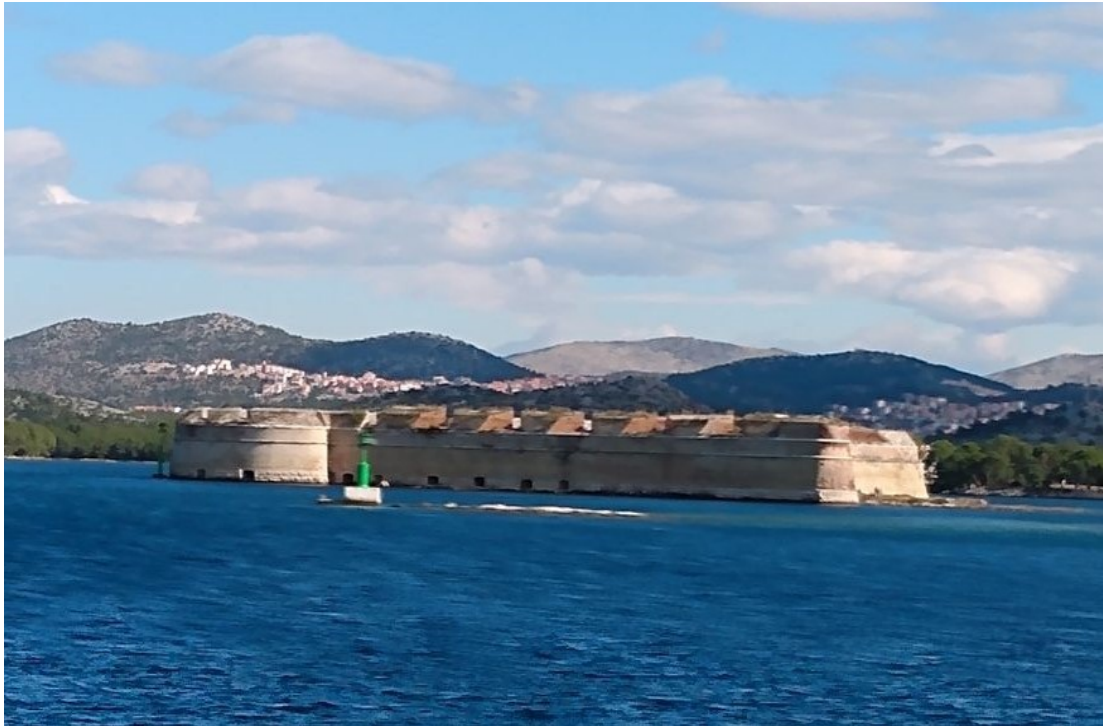
Die Venezianische St. Nikola Festung, welche die Einfahrt in den Kanal Sveti Ante (St. Anton) und somit den Zugang nach Šibenik kontrollierte.