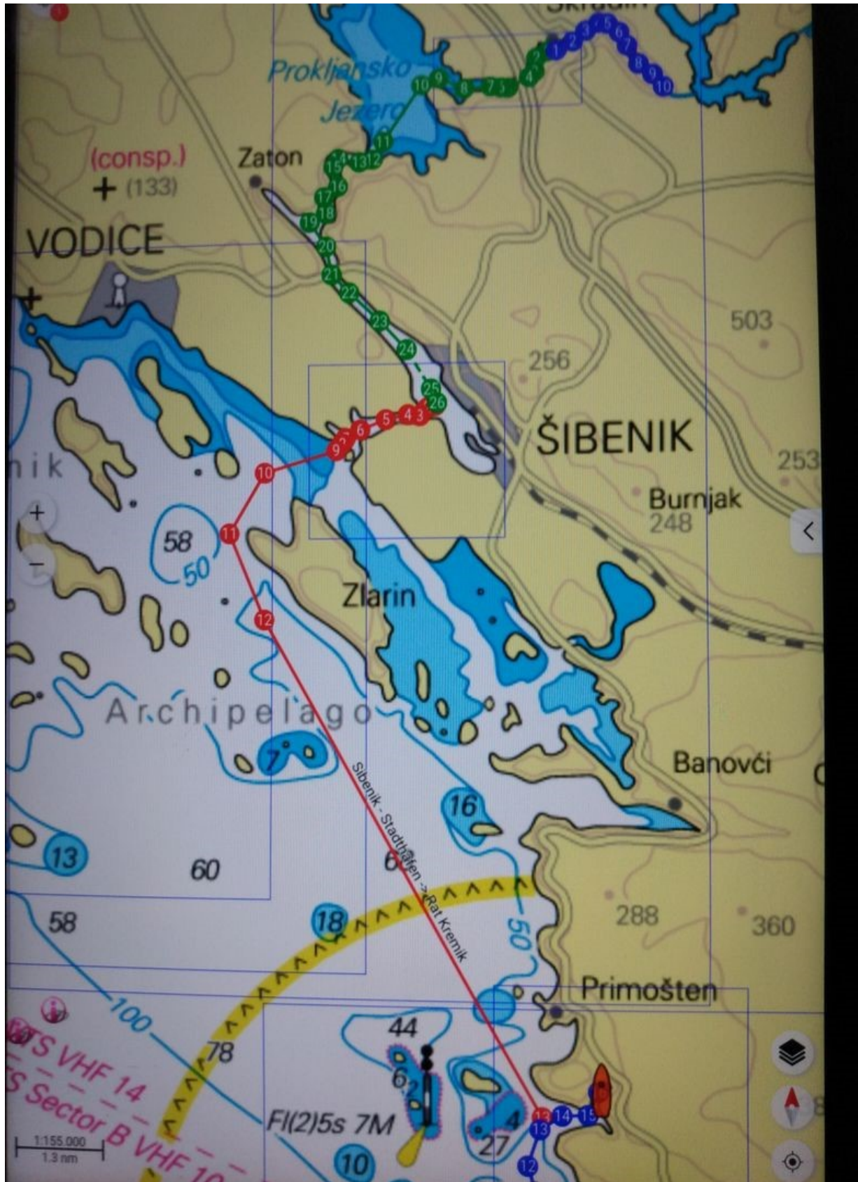
Tag 3: Tagestörn Skradin - Šibenik (grün) – Marina Kremik (rot) (25 NM) Blau der Abschnitt mit dem Ausflugsboot Skradin – Nationalpark Krka