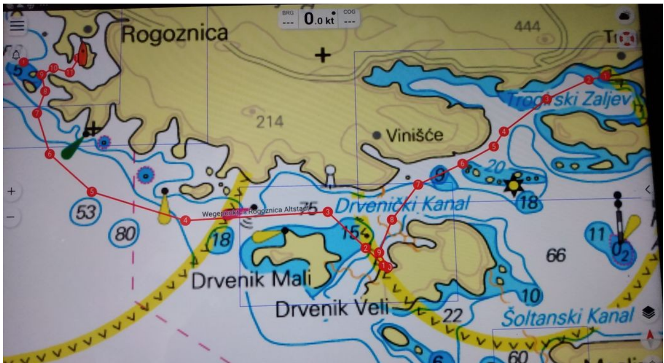
Trogir - Uvala Mala Luka (Drvenik Veli) – Rogoznica (Stadthafen) 18 NM

Die Adria, - „Karibik der Alten Welt“. Und wenn man das Blau des Wassers genau so malen würde, wie es ist, bestünde die Gefahr, dass das Bild von der Kritik als Kitsch abgetan würde.