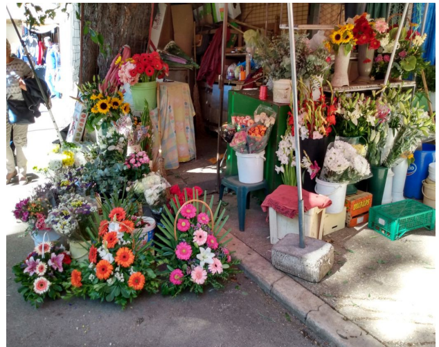
.....hier ist jeden Tag Erntedankfest